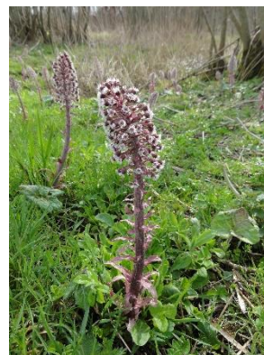
Groot hoefblad – heeft ook schubben