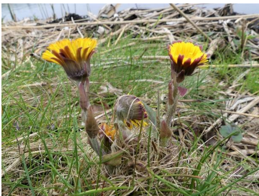
Klein hoefblad – bloemstengel met schubben

Twee van de eerste bloeiers in het voorjaar zijn het Groot hoefblad en het Klein hoefblad. Wat ze gemeen hebben is de naam hoefblad, dit verwijst naar het blad dat de vorm heeft van een hoef (groot rond). De bloemen van deze planten verschijnen voor het blad. Een ander opvallend detail is dat beide planten schubben op de bloemsteel hebben.