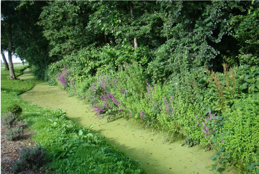
De slootkant op weg naar hole 1