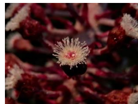
Groot hoefblad- vrl bloem