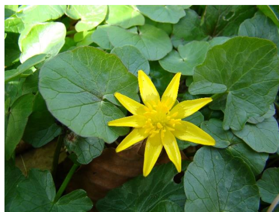
Gewoon speenkruid met glanzend bla