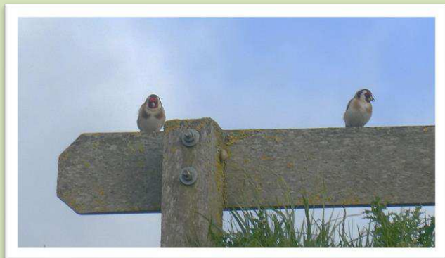
Putters al succesvol.