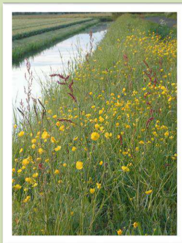
Boterbloem en zuring