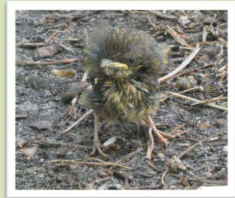
Een jonge Roodborst wil eten.