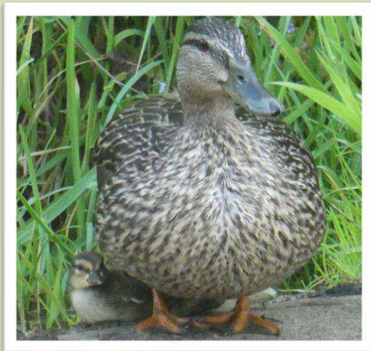
Moeder eend heeft nog maar één kind