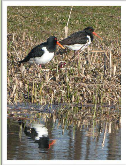
Aalscholvers in het zonnetje.

De vogels lieten zich goed zien. Het leek of ze genoten van al die rust.