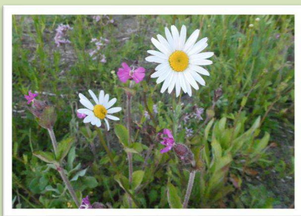
Koekoekbloem en Margriet