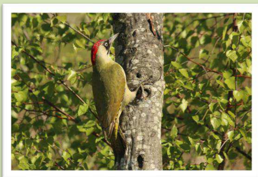
Groene specht op zoek naar nestplaats.