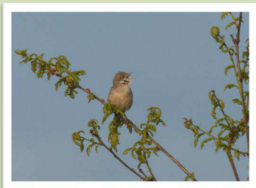
Grasmus op zoek naar partner.