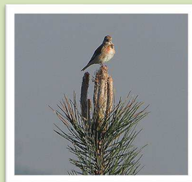
Kneu op zoek naar voedsel.