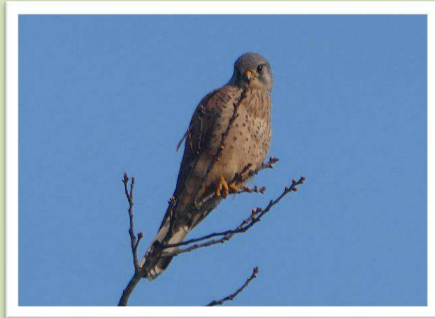
Torenvalk op de uitkijk.