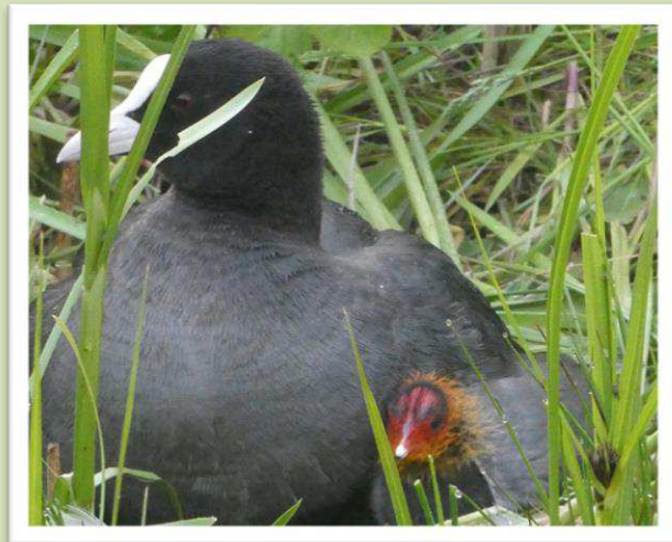
De Meerkoeten schuilen dus bij moeder

Nu kan iedereen gelukkig zelf weer genieten van alle natuur op Tespelduyn!