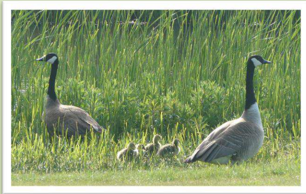
Canadese ganzen passen goed op hun kinderen.

Maar ook de eerste kinderen lieten zich zien.