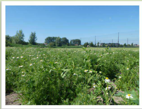
eind juni 2019

In maart 2019 zijn we begonnen met het afgegraven en schraal maken van een stuk grond naast de fairway van hole 7. Daarna is een speciaal veldbloemenmengsel ingezaaid. In de lente zagen we voorzichtig de eerste zaailingen kiemen. Halverwege de zomer was het veld voor de eerste keer goed in bloei.