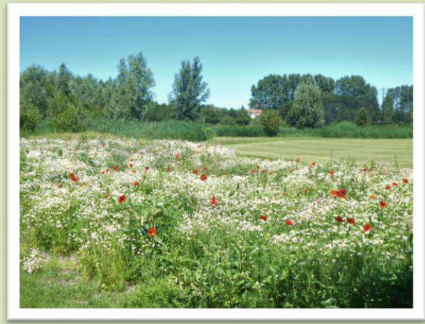
begin juli 2019

In de loop van de maanden kwamen steeds meer soorten op. Zoals Klaprozen, Korenbloemen, Koekruid, Perzikkruid, Bolderik en Hennepnetel en kleurrijke Fresiaatjes.